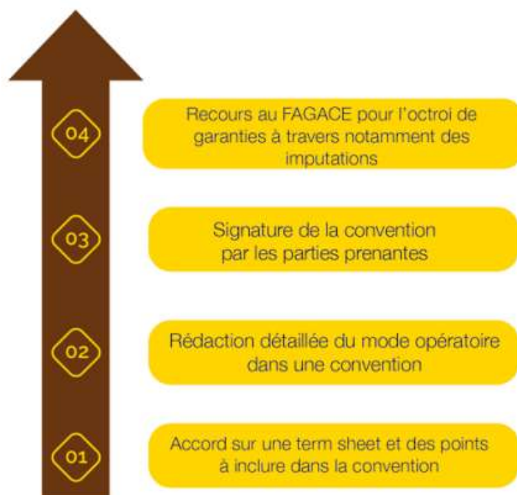
Schéma du mode opératoire du FAGACE

Pour ce faire, Le FAGACE a signé plusieurs accords de partenariat et ou conventions de garantie de portefeuille avec des banques prêteuses pourvoyeuses d'opérations à garantir.